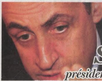
Nicolas Sarkozy, président de la République

« Son montant et SES MODALITÉS seront arrêtés une fois que nous aurons fixé ensemble ses priorités. »