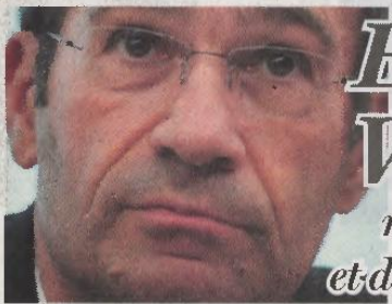
Éric Woerth, ministre du Budget et des Comptes publics

« Autant boire un pastis POUR GUÉRIR une gueule de bois. »